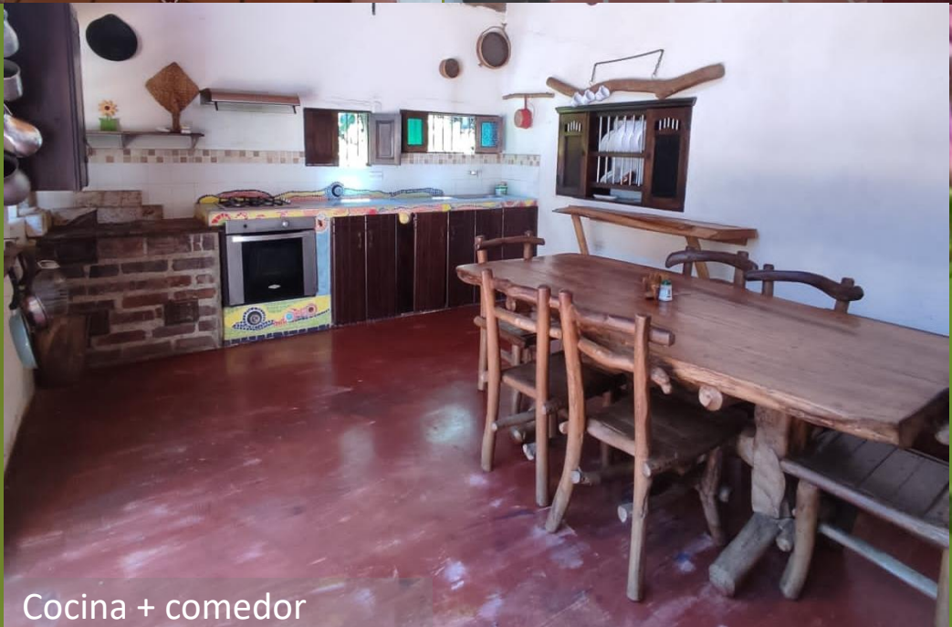
Cocina + comedor