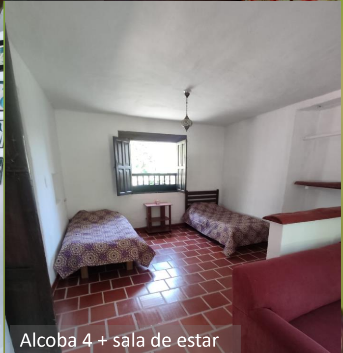
Alcoba 4 + sala de estar