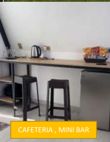
CAFETERIA , MINI BAR