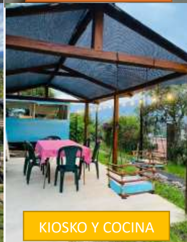
KIOSKO Y COCINA